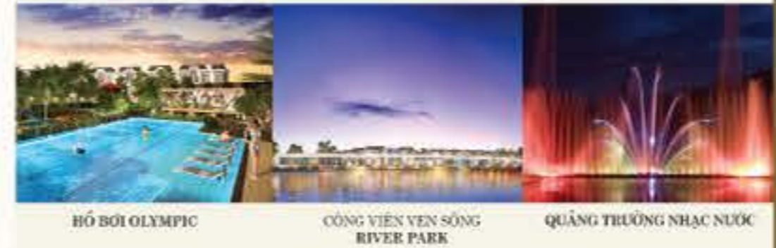
HỒ BƠI OLYMPIC CÔNG VIÊN VEN SÔNG RIVER PARK QUẢNG TRƯỜNG NHẠC NƯỚC